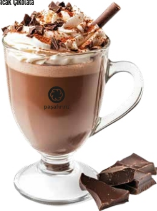
· Sıcak Çikolata