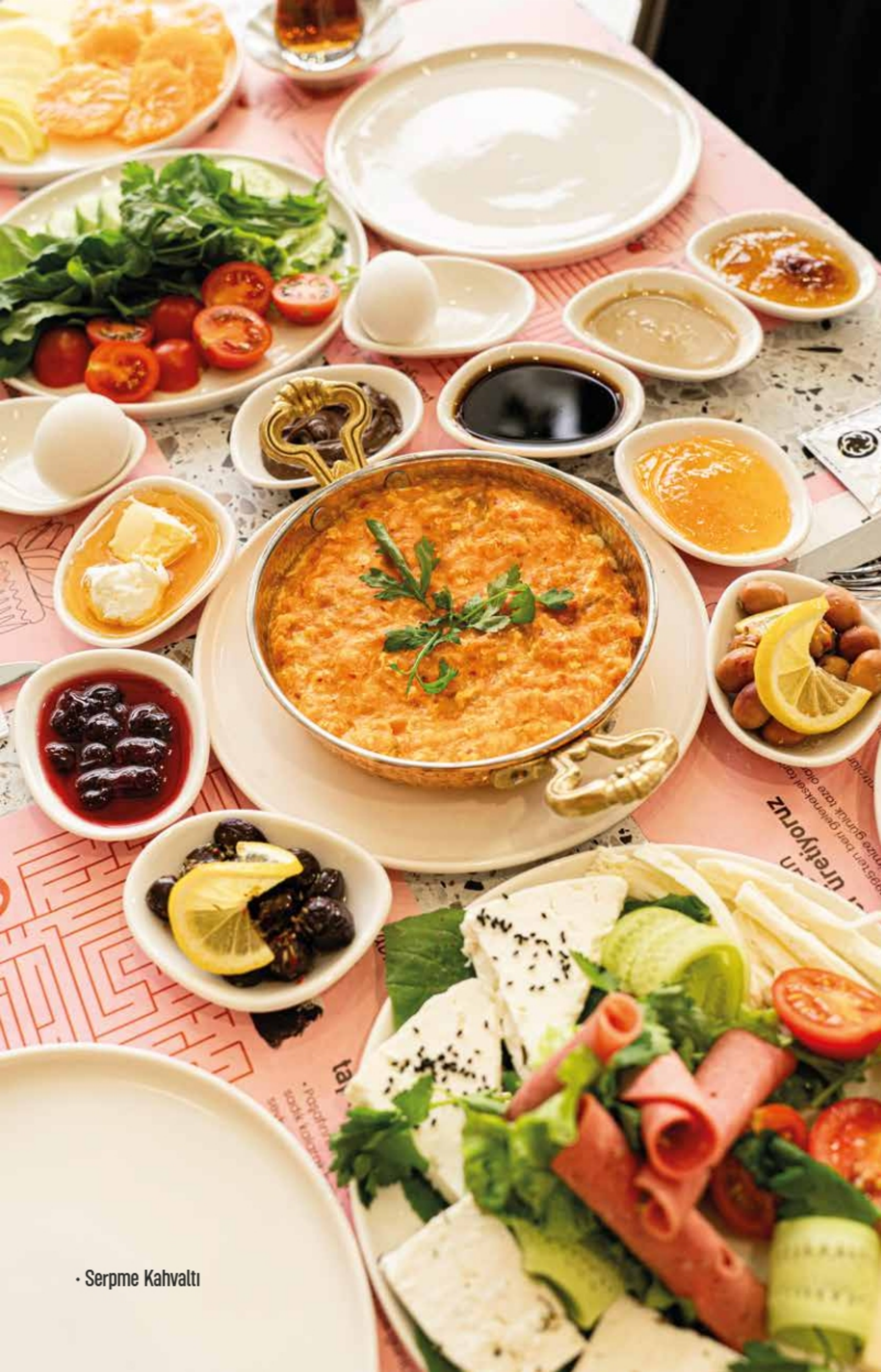
• Serpme Kahvalti